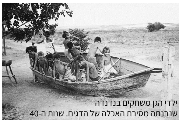
ילדי הגן משחקים בנדנדה שנבנתה מסירת האכלה של הדגים. שנות ה-40

כה חבל לעזב חדר אכל נבנה, רחב דשא ירק, רום אסם מתנשא. לגבעות היפות ממזרח למעוז שלום, ולכל נוף שקיעה מאדים שנגוז שלום, שלום, שלום!