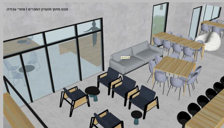
מבט מתוך מועדון חברים אזורי עבודה